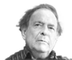
Ramón Tamames | 26/12/2018